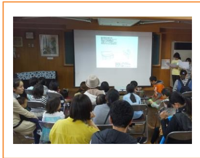
カフェ ブース出展