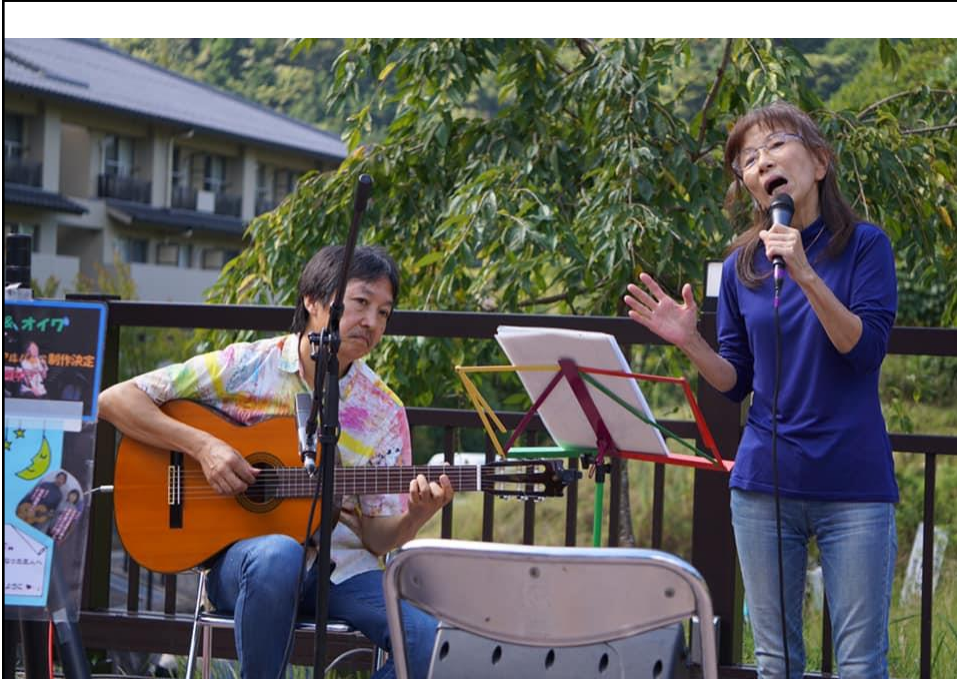
緑の木々や駅での演奏が異空間にいるようで最高に素敵でした。