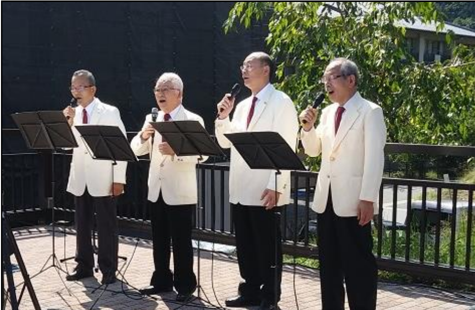
フランス語で4人の歌手(キャトルシャンテ)大津市在住の男性によるアカペラ演奏